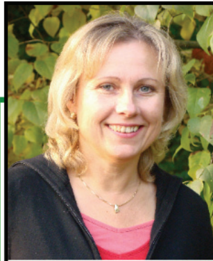
Stvtr. Vorsitzende Manhartsbrunn

Die Pfarre Manhartsbrunn hat eine neue Telefonnummer: 068120490274