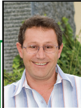
Stvtr. Vorsitzender Großebersdorf